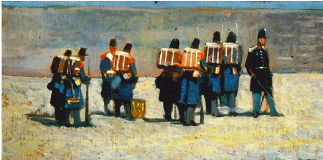
Giovanni Fattori, Soldati francesi