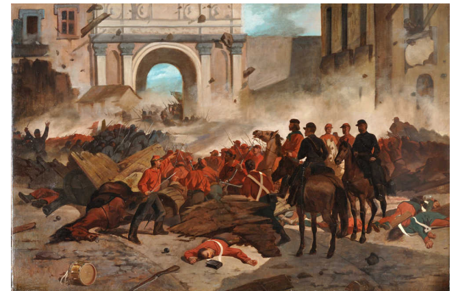
Giovanni Fattori, Garibaldi a Palermo