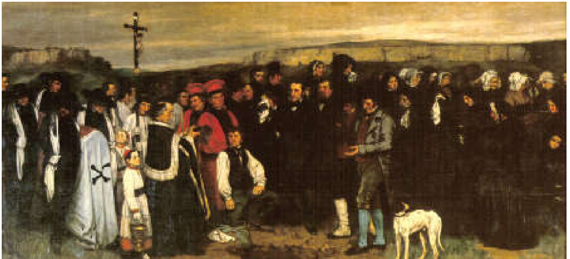
Gustave Courbet, Un funerale a Ornans, 1849, olio su tela, cm 315 x 668 cm, Parigi, Musèèe d'Orsay