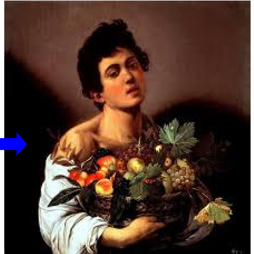
Caravaggio, Ragazzo con canestro di frutta, Galleria Borghese, Roma