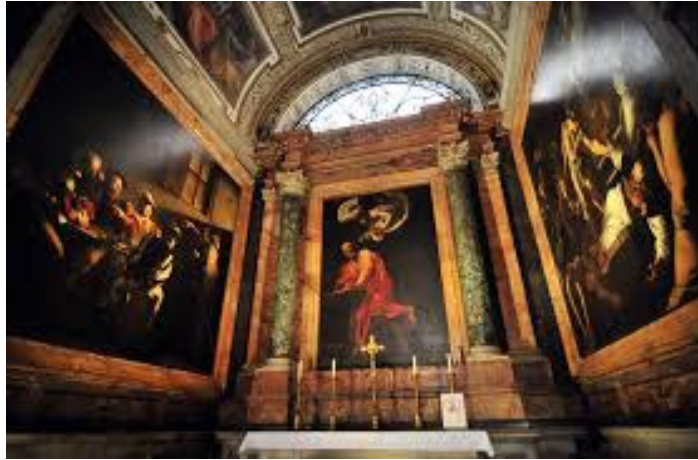
Vocazione di San Matteo San Matteo e l'angelo Martirio di San Matteo

Cappella Contarelli, San Luigi dei Francesi Roma