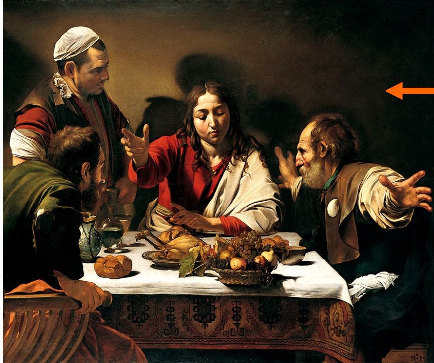
Caravaggio, Cena in Emmaus, Londra, 1601

L'uso mirato della luce ritaglia le forme dal buio, facendo risaltare la drammaticità dei personaggi.