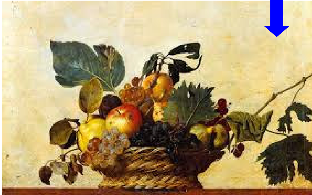
Caravaggio , Canestra di frutta, Pinacoteca Ambrosiana, Milano

Interesse per la rappresentazione diretta e precisa della REALTA'