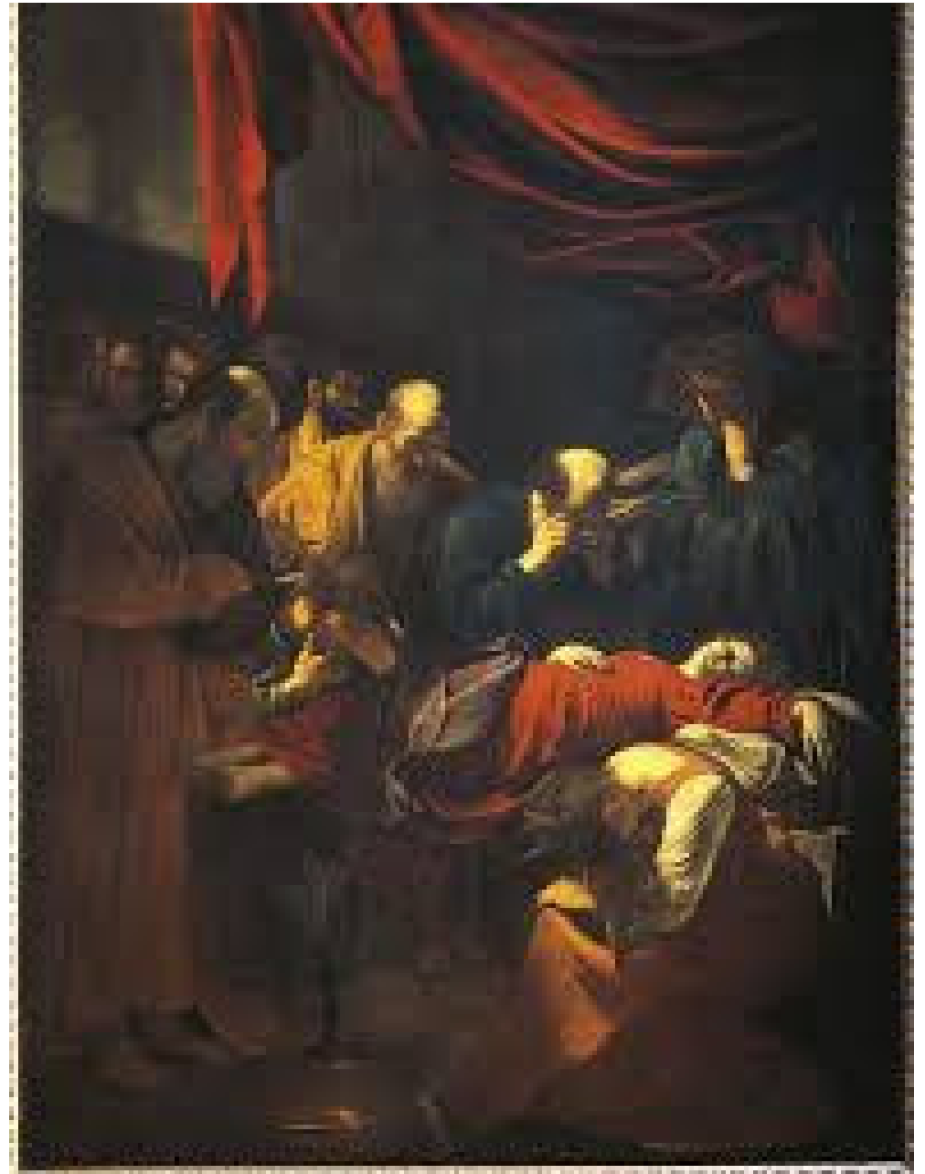
Caravaggio, Morte della Vergine, Louvre, Parigi

La Vergine dipinta come una qualsiasi donna morta