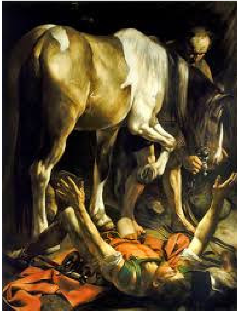
Caravaggio, Conversione di San Paolo, Santa Maria del Popolo, Roma

Utilizzo di luci e ombre sia come mezzi espressivi che per dare tridimensionalità. La luce illumina i personaggi mentre l' ombra assorbe tutto ciò che non è essenziale al racconto