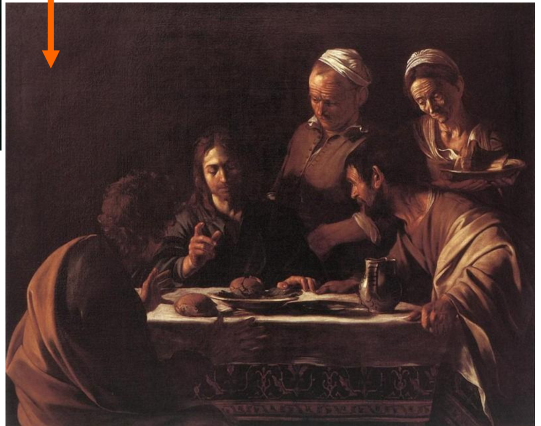
Caravaggio, Cena in Emmaus, Pinacoteca di Brera, Milano, 1606

colori meno vivaci con gamma cromatica ridotta quasi al monocromo, minor quantità di dettagli