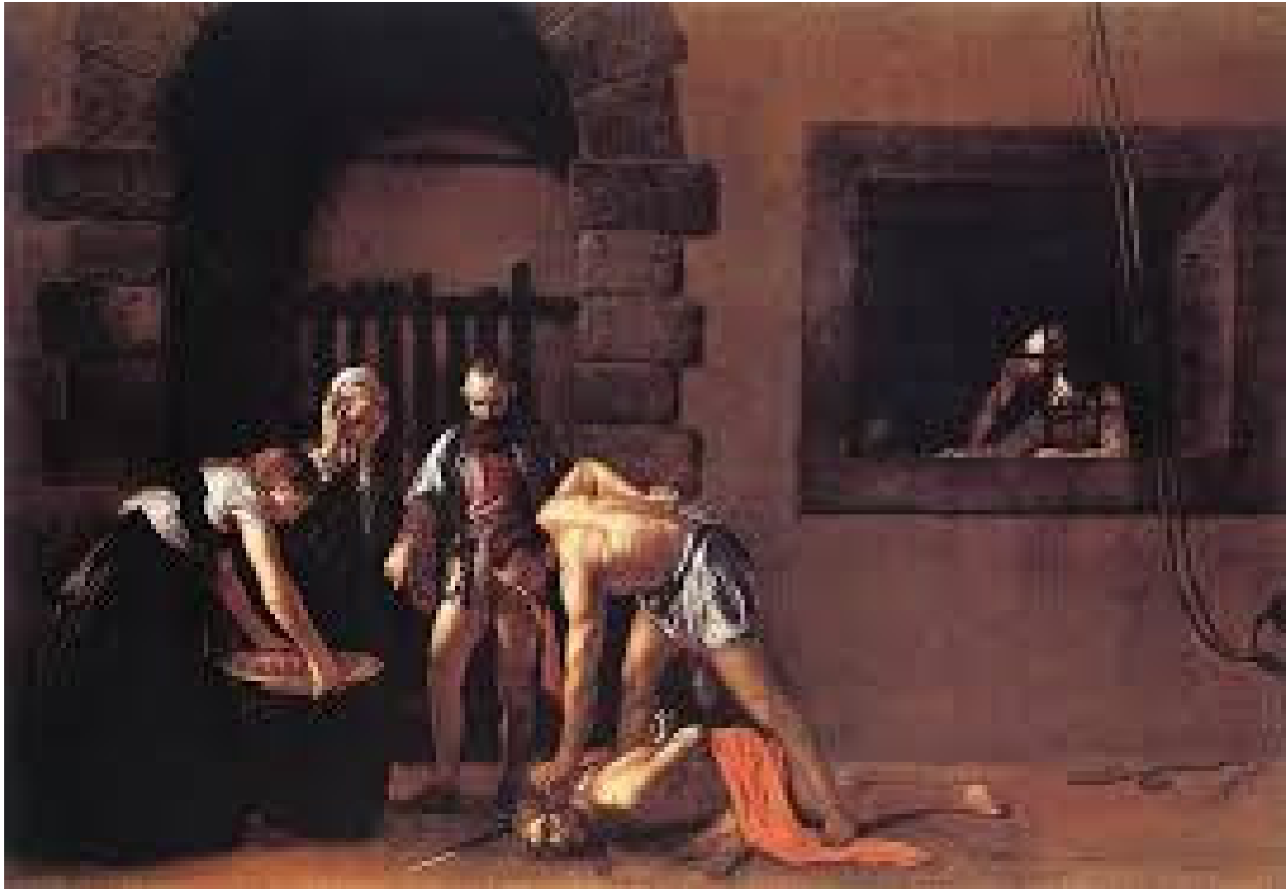
Caravaggio, Decollazione di San Giovanni Battista, Concattedrale di San Giovanni, La Valletta (Malta), 1608