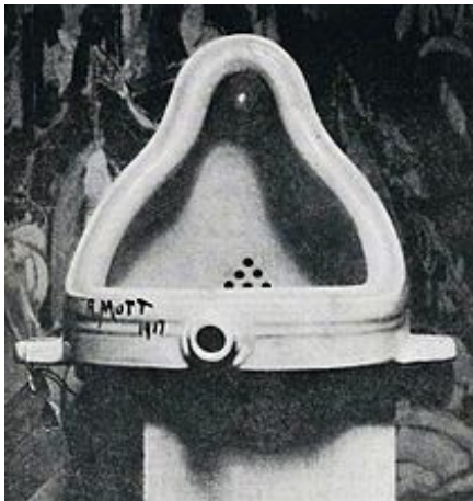
DUCHAMP - FONTANA 1917

MARCEL DUCHAMP inaugura il genere artistico del ready-made (pronto per l'uso): un oggetto comune viene tolto dal contesto abituale e trasformato in un'opera d'arte.