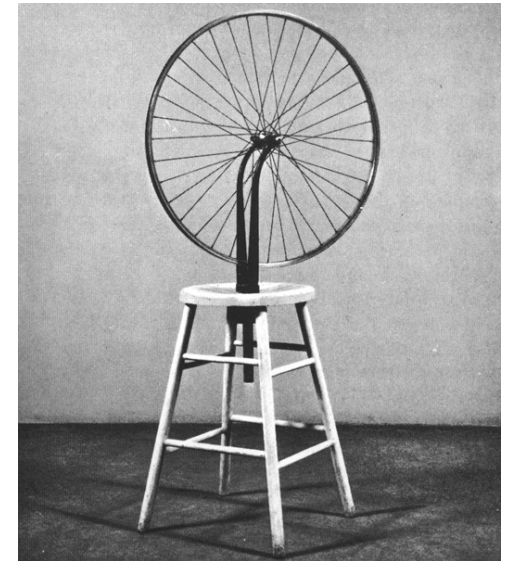
RUOTA DI BICICLATTA-1913